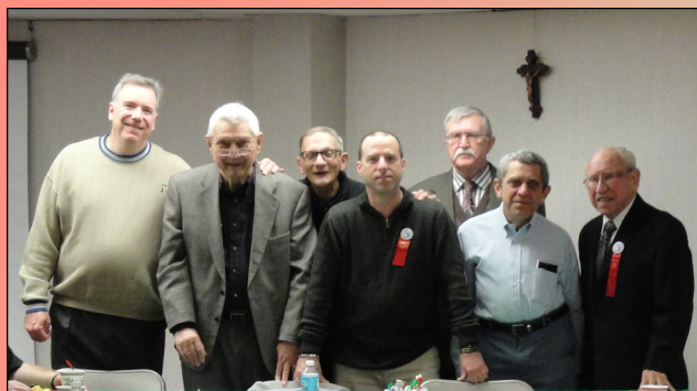
Pictured above: The Holy Name Society members present during the meeting.