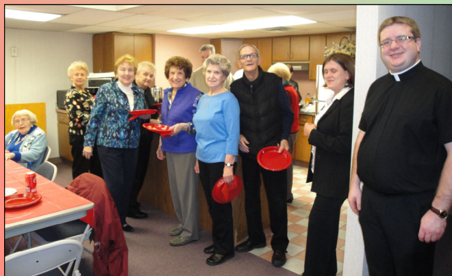
Pictured above: Hungry parishioners waiting to be served.

The Holy Name Society, enjoyed togetherness with members, wives, and wives of former members, at a Christmas Celebration, Sunday, December 9th after the 8:30 A.M. Mass, in the lower level of the Rectory.