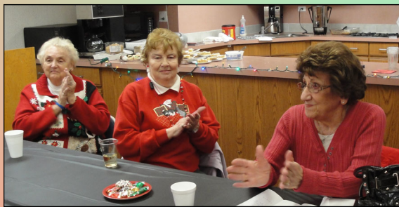
Pictured above: The Catholic Women's Club Presidents.

On Tuesday, December 4th, the Catholic Women's Club , after a short meeting, gathered for a Christmas Party.